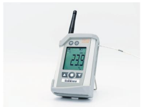
RF ValProbe® II